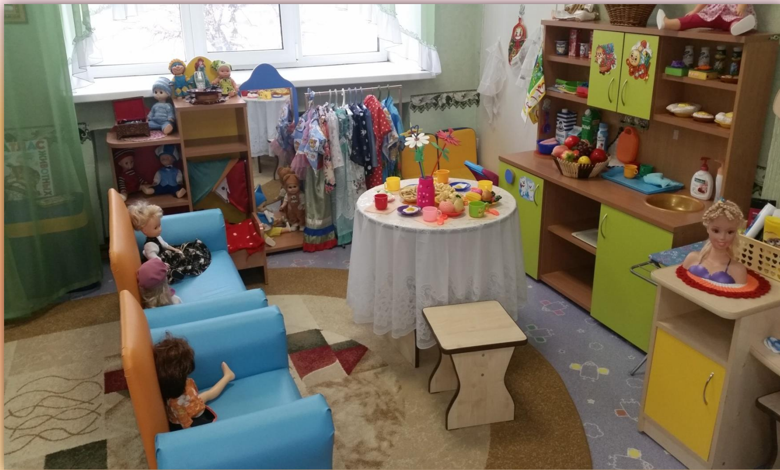
Уголок для девочек

Центр сюжетно - ролевых игр наиболее востребован детьми. Подобранный и дополненный родителями материал позволяет комбинировать различные сюжеты, создавать новые игровые образы.