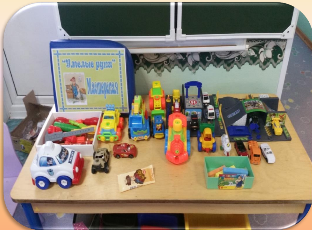
Мастерская «Умелые руки»