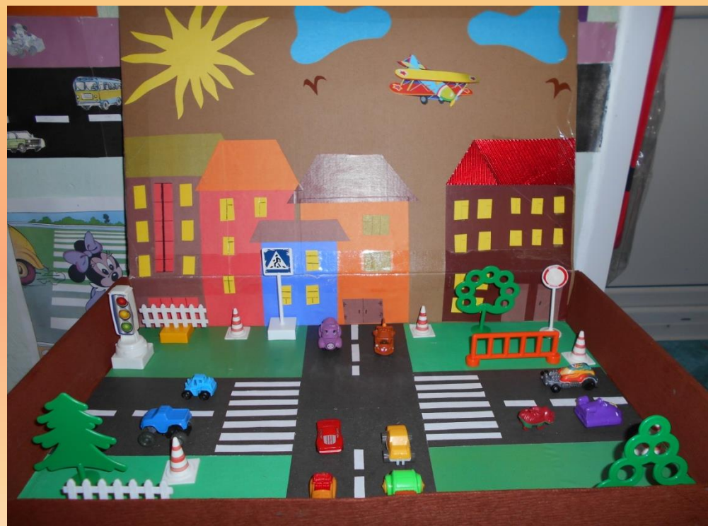
Мобильный макет улицы